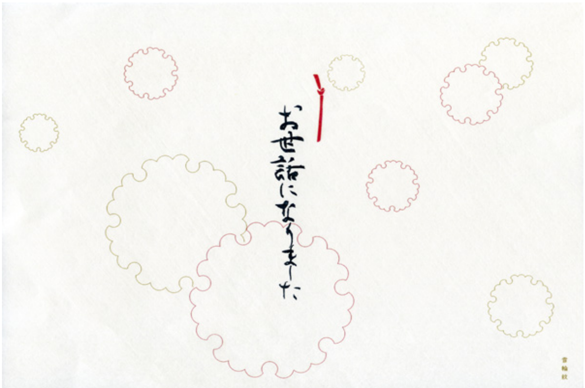
D.お世話になりました