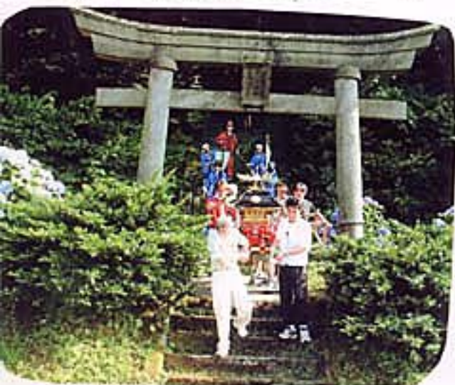
7月、夏祭りの日がきました。 みこしが、村をまわります。