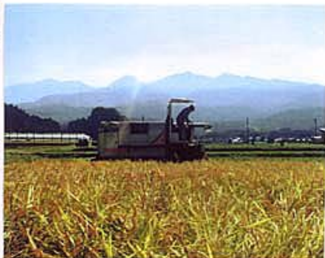
待望の稲刈りです。昨年は、自然が 猛威をふるいました。夏の猛暑に、稲は 丈を伸ばせず、穂を沢山つけることが できませんでした。 それでも、無事に収穫させて頂く ことができて、ありがたく思います。