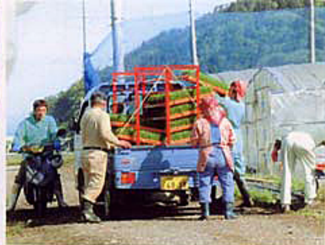
苗ができてあかりました。 農家の方々が. ひき取りにみえます。