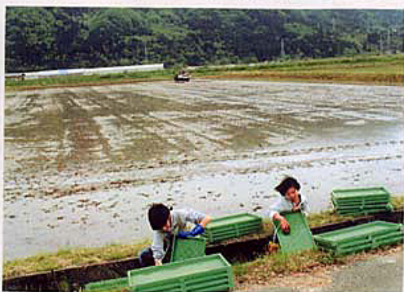
5月. 1カ月間続く田植え です。晴れの日もあれば、 冷たい雨の日もあります。 子供達も休日には、 苗箱洗いや、田植機へ の苗積みを手伝って くれます。