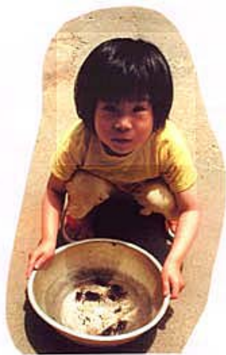
カニさんつかまえたよ。 お父さんとお母さんと。 ほら、赤ちゃんもいっぱい いるよ。