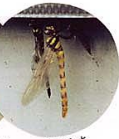
農園の作業場から巣立つ仲間達。