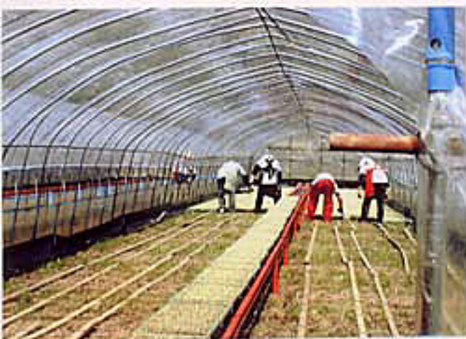
4月初旬. ハウスに稲の苗が入りました。 気を抜けない毎日が. 始まります。